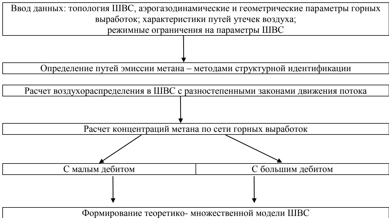
Рисунок 1 – Схема решения задачи распределения метана по сети горных выработок

существования) зон ШВС и влияния на дебит метановоздушной смеси в ШВС поступления в нее метана. Решение задачи в такой постановке необходимо для анализа в дальнейшем газовой обстановки в ШВС с исключением участков, не подверженных влиянию метана, что существенно снижает трудоемкость расчетов.